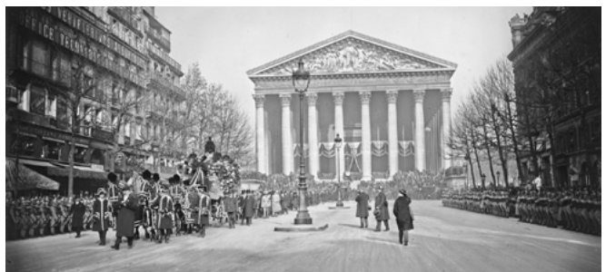
Optoget ved Gabriel Faurés statsbegravelse i Paris, 8. november 1924.