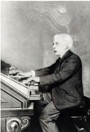
Gabriel Fauré ved orgelet i Église de la Madeleine, ca. 1895

Et requiem er en dødsmesse i den katolske kirke, og derfor er teksten på latin. Titlen Requiem stammer fra de første ord i messens tekst: 'Requiem aeternam dona eis Domine', der betyder 'Herre, giv dem den evige hvile'.