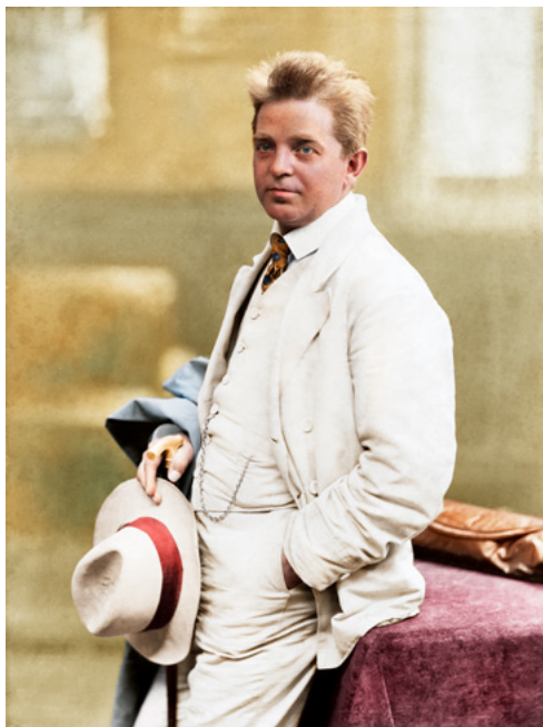
Koloreret foto af Carl Nielsen

Symfoni nr. 2 med titlen De fire temperamenter (1901–02) minder ikke om nogen af Carl Nielsens øvrige symfonier. Den er en karaktersymfoni, hvor hver sats tager udgangspunkt i en af de fire mennesketyper, man i antikken mente, der fandtes: kolerikeren (den hidsige), flegmatikeren (den besindige), melankolikeren (den sørgmodige) og sangvinikeren (den muntre).