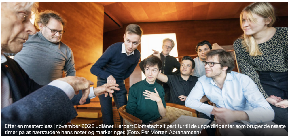
Efter en masterclass i november 2022 udlaner Herbert Blomstedt sit partitur til de unge dirigenter, som bruger de neste timer pa at nerstudere hans noter og markeringer.