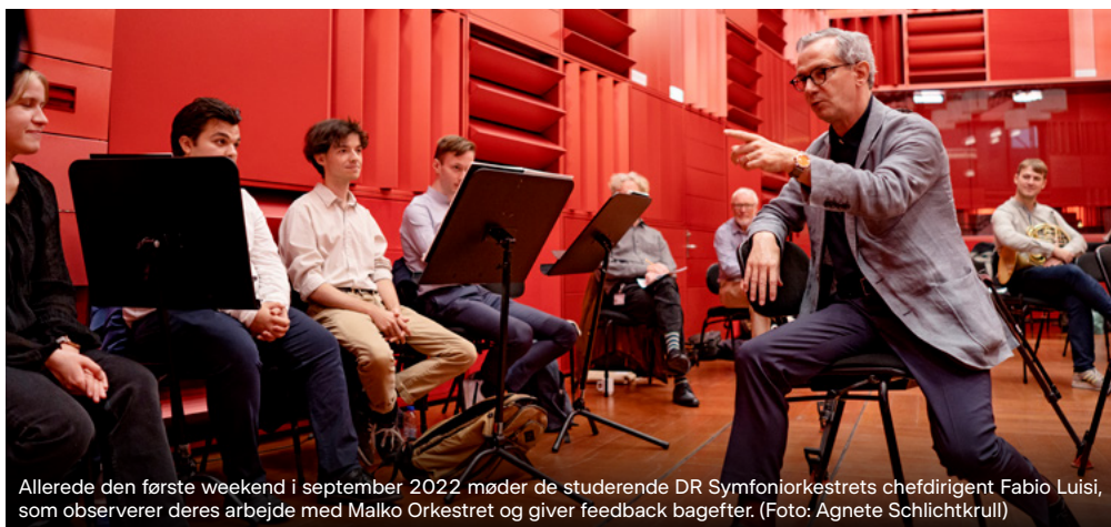
Allerede den forste weekend i september 2022 moder de studerende DR Symfoniorkestrets chefdirigent Fabio Luisi, som observerer deres arbejde med Malko Orkestret og giver feedback bagefter.